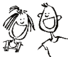
Chiro Sint-Jan Kuringen Hiel